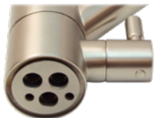
Photo de la base du robinet.