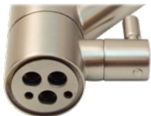
Faucet bottom picture.